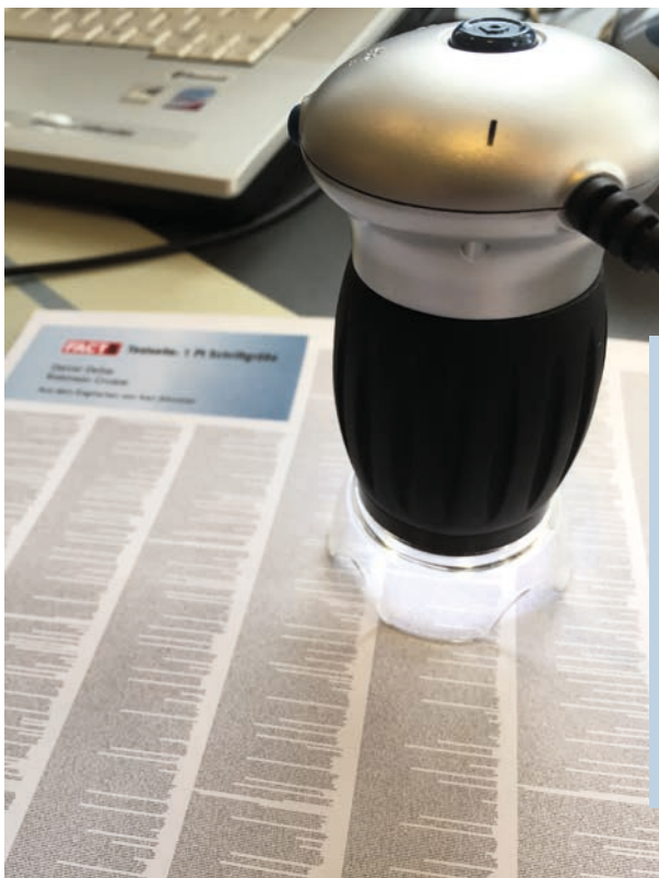
UNTER DER LUPE: Das Ergebnis des Robinson-Tests lässt sich nicht mit dem bloßen Auge, sondern nur mit einer Lupe überprüfen.

Auch die Bedienung des C542dn und des MC573dn wurde unter die Lupe genommen.