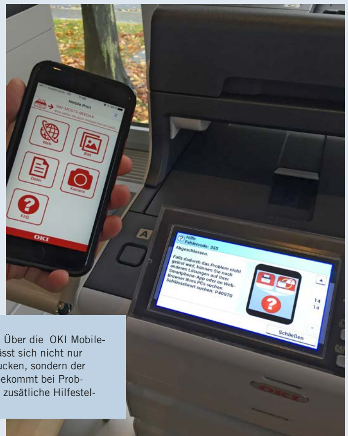
DAS HILFT: Über die OKI Mobile-Print-App lässt sich nicht nur kabellos drucken, sondern der Anwender bekommt bei Problemen auch zusätzliche Hilfestellungen.