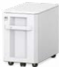
Große Papierkassette für 3.000 Blatt