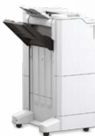
Stapel-/Heft- einheit für 4.000 Blatt (Brückeneinheit erforderlich)